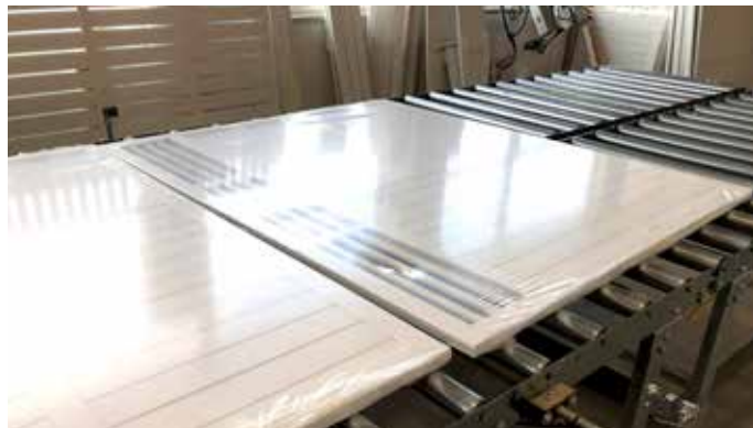
Aiapaneelid termokahanevas kiles

Tooted pakitakse peale kuivamist termokahanevasse kilesse, mis kaitseb tooteid kuni lõpptarbijani jõudmiseni nii tolmu, pori ja niiskuse kui ka transpordi ja ladustamise käigus tekkida võivate mehhaaniliste kahjustuste eest.