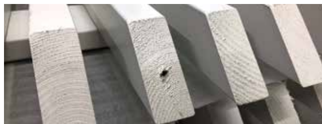
Riputusaasadest jäänud väikesed augud