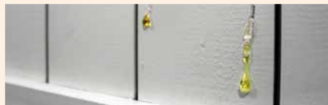
Vaik võib jooksmata hakata

Kõik selles dokumendis mainitud eripärad (klambripüstoli jäljed, riputuskonksude augud, värvitilgad, oksakohad, ebäühtlane pind, ilma värvita nurgad, nähtavad vaigupesad, värvi täis sooned, väikesed toonierinevused) ei kuulu reklameerimisele.