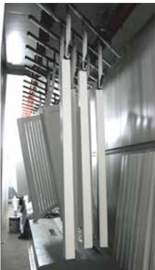
Värvitud tooted kuivamiskambris

Oleme investeerinud tänapäevasesse värvimistehnoloogiasse, mis võimaldab värvida väiksemaid tooteid nagu aiapaneelid, postid ja aiamööbel. Värvime tooteid valgeks ja halliks, kasutades moodsat flow-coat tehnoloogiat vihmutuskambri meetodil. Värvimiskambri niisutussüsteem aitab tagada värvimiseks sobivat keskkonda. Pärast värvimist kuivavad detailid 30 m pikkuses kuivatuskambris, mis tagab kuivamisprotsessi kontrollitavuse.