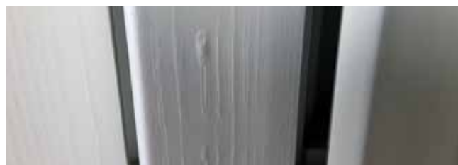
Puidu ebäühtlane pind

Meie toodete keerukuse, nurkade ja mitmetahulisuse tõttu võib juhtuda, et värv ei jõua igasse nurka, näiteks riputuskonksudest tekkinud väikestesse aukudesse.