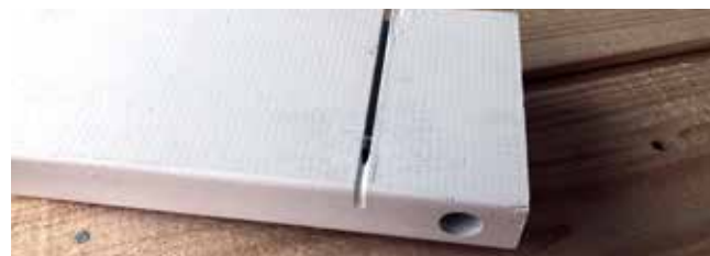
Detaili värvi täis soon

Hoiustage toodet kuivas, eemal otsesest päikesevalgusest. Ärge hoiustage soojades siseruumides.