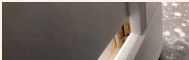
Värv ei jõua kõigisse nurkadesse

Selliste toodete puhul on ka sooned ja tapikohad värviga kaetud ning paigaldus võib olla tavapärasest raskem. Pärast paigaldamist puutuvad värvitud tooted kokku erinevate ilmastikutingimustega nagu tuul, vihm, päike jne. Ilmastikutingimustest tekkivad värvitud toodete väikesed toonierinevused ei ole defektid.